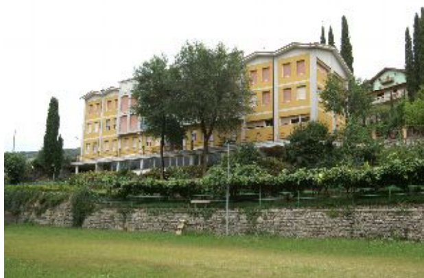
Lo studentato di Rovereto

Il patto formativo che viene stabilito all'ingresso, tra struttura, famiglia e ragazzo impegna su pochi punti fondamentali: anzitutto il rispetto della libertà propria ed altrui, il che vuol dire sapersi limitare. Poi porsi nelle condizioni di crescere come individui, senza dimenticare che attorno c'è una società. Vivere in una struttura nata sul pensiero rosminiano significa condividere lo spirito di servizio. Il convitto posto sul Colle di Miravalle (50 posti letto) non è affatto costoso: le famiglie spendono meno di 400 euro al mese e l'utenza tradizionale è costituita da studenti tra i 16 e i 19 anni che vengono tutti da fuori. A condurre la struttura è l'inossidabile padre Giuseppe Giovannini, 80 anni ben portati (di cui venti alla guida del convitto maschile) che dice: "Venite a conoscerci".