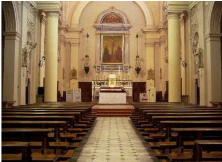
Interno del Santuario del SS. Crocifisso

Sì, Rosmini si colloca sulla linea della più viva e feconda Tradizione, quella di avvertire la carità intellettuale come una delle forme più urgenti di carità, non meno necessaria di altre forme pur necessarie. Egli è consapevole che la fede in Gesù, proprio perché attiene la verità tutta intera e l'amore che salva, non riguarda solo i sentimenti personali e la dimensione del privato, ma interpella l'intelligenza e la libertà dell'individuo e della società. Per questo può parlare all'uomo di sempre, anche all'uomo moderno; può incontrare e fecondare ogni società e cultura.