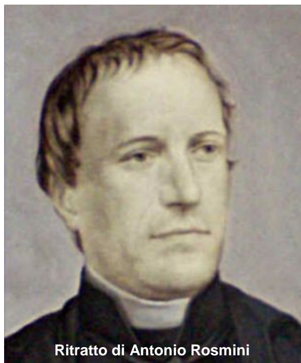
Ritratto di Antonio Rosmini

L'esperienza di Rosmini suggerisce un'ulteriore condizione per colui che crede, pensa e dialoga: l'umiltà. La sua vicenda è stata segnata anche da sofferenze e umiliazioni non piccole proprio da parte di coloro che egli amava nella fede. Attesta una umiltà profonda che si tradusse nella più