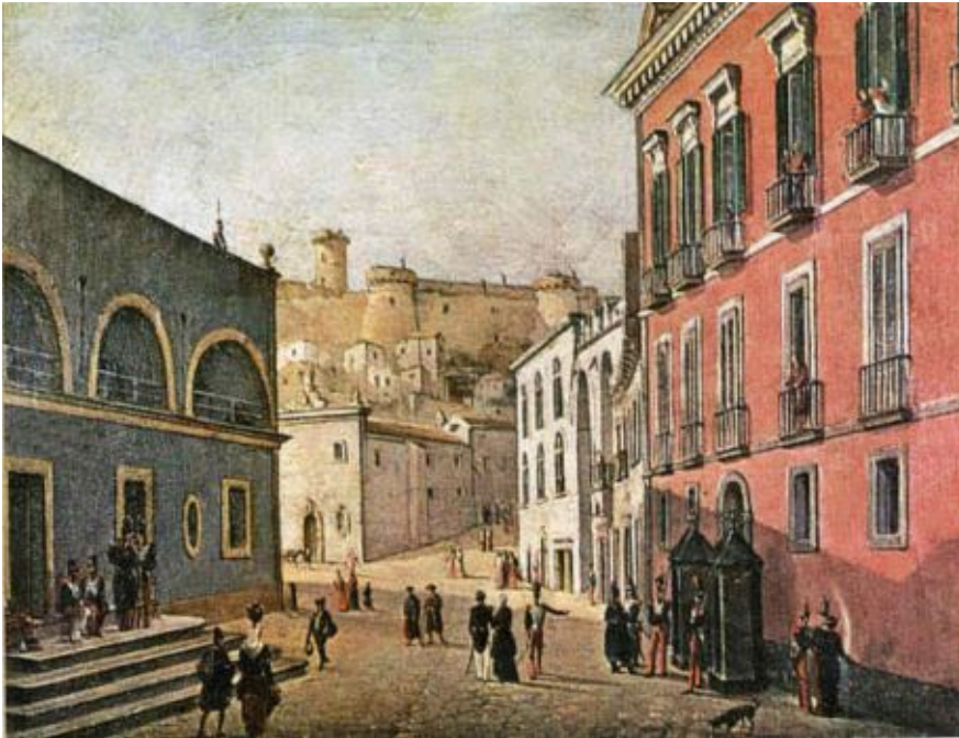
1849: veduta di Gaeta col palazzo reale dove abitò Pio IX

virtualmente ogni cosa dal punto di vista della conoscenza, ha bisogno per determinarsi della ricchezza della realtà concreta e storica, che si offre alle modificazioni del corpo, come sentimento fondamentale, e fa sì che l'uomo possa esprimere la realtà in senso spaziale e temporale. Queste tesi vengono sviluppate nel Nuovo Saggio sull'origine delle idee , opera pubblicata significativamente a Roma in tre volumi nel 1830.