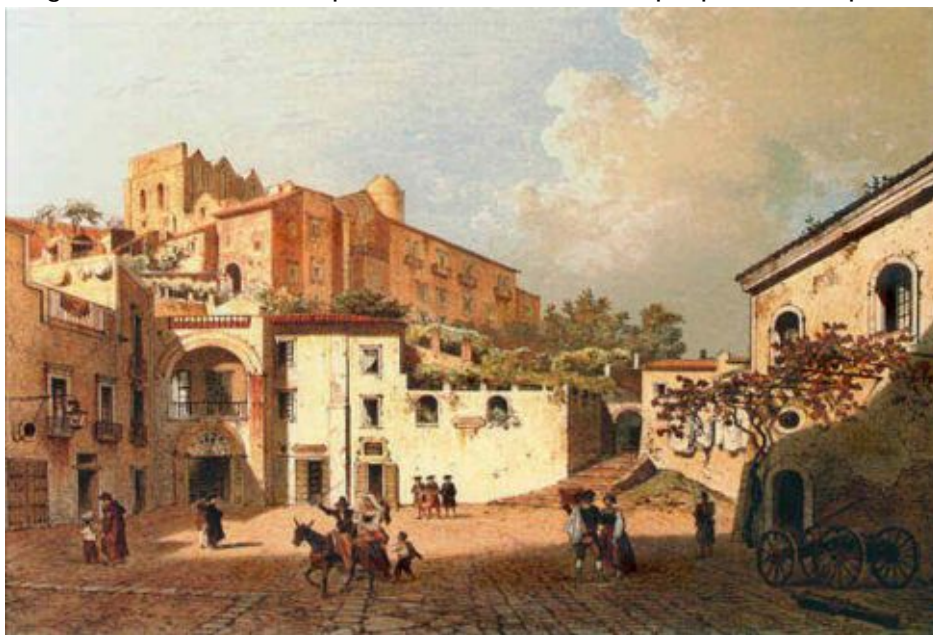
Gaeta: locanda del giardinetto dove nel 1849 Pio IX alloggiò al suo arrivo

Concordato col Piemonte e il progetto di una Confederazione degli Stati italiani (Regno sabaudo, Repubblica di Venezia, Stato pontificio, Granducato di Toscana e Regno di Napoli). Non riuscendo ad ottenere l'alleanza militare, egli rinuncia al mandato, ma viene trattenuto a Roma dal Sommo Pontefice, che gli fa annunciare di prepararsi al cardinalato. Avvenuto l'assassinio di Pellegrino Rossi, si fa il nome di Rosmini come Presidente dei Ministri e Ministro dell'Istruzione del